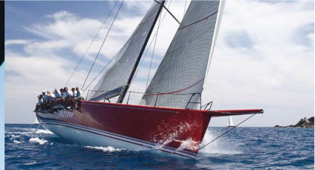
Kurs auf eine der vielen Trauminseln der BVI: Ganz neu ist das 5-Sterne-Luxus-Resort auf Scrub Island.