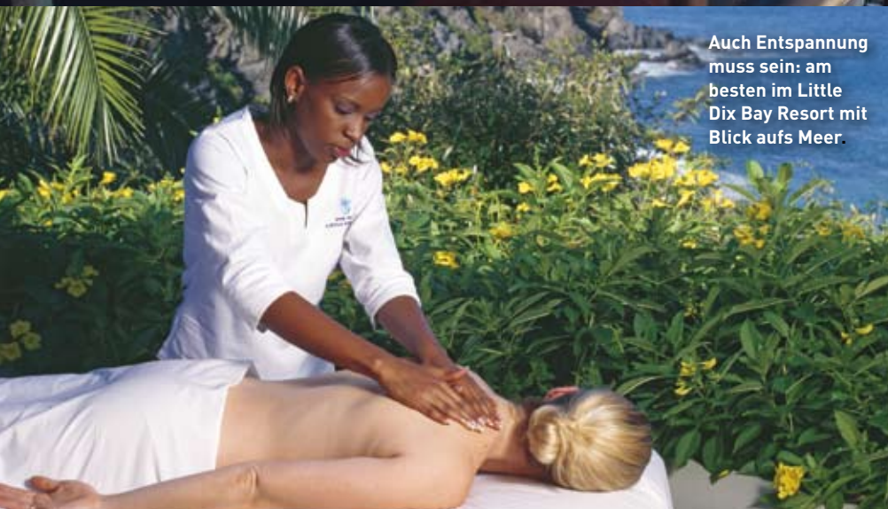
Auch Entspannung muss sein: am besten im Little Dix Bay Resort mit Blick aufs Meer.