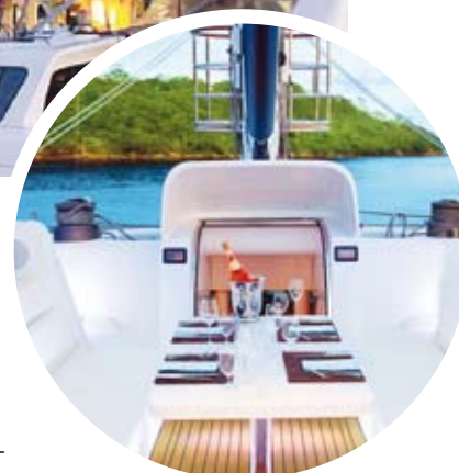
Richard Bransons 32-Meter-Katamaran „Necker Belle“ wird mitsamt der 7-köpfigen Crew gechartert.

Ein neues, in Planung befindliches Hotelprojekt entsteht auf Mosquito Island. Die Insel wurde kürzlich vom Milliardär Sir Richard Branson, dem Gründer des Virgin-Imperiums und Abenteurer, erworben und soll innerhalb der nächsten Jahre zu einem exklusiven ökologischen Resort umgebaut werden. Richard Branson besitzt bereits das berühmte Necker Island, auf dem Hollywoodstars oder jeder, der sich's leisten will, einen ungestörten und paradiesischen Urlaub genießt, dafür aber auch pro Nacht rund 52.000 USD für die Exklusivität der eigenen Insel zahlt. Seit Kurzem verchartert Bransons Virgin Limited Edition während der Wintermonate auch den Super-Katamaran „Necker Belle“ für bis zu 12 Personen.