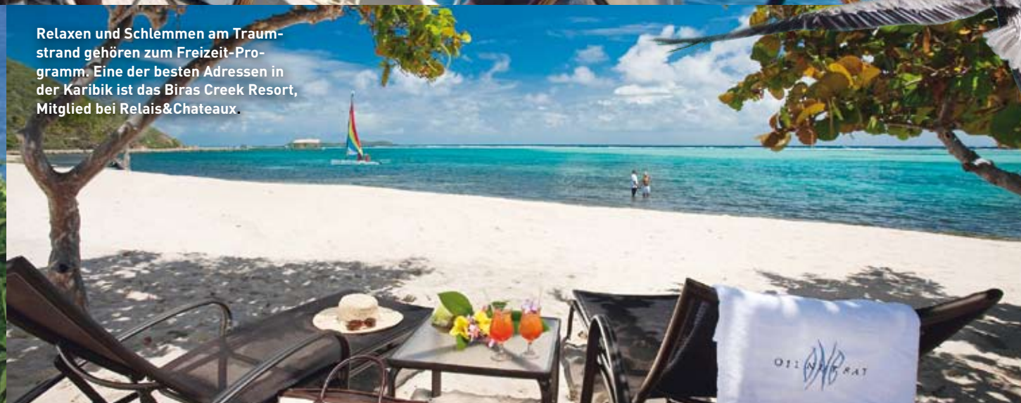
Relaxen und Schlemmen am Traumstrand gehören zum Freizeit-Programm. Eine der besten Adressen in der Karibik ist das Biras Creek Resort, Mitglied bei Relais&Chateaux.