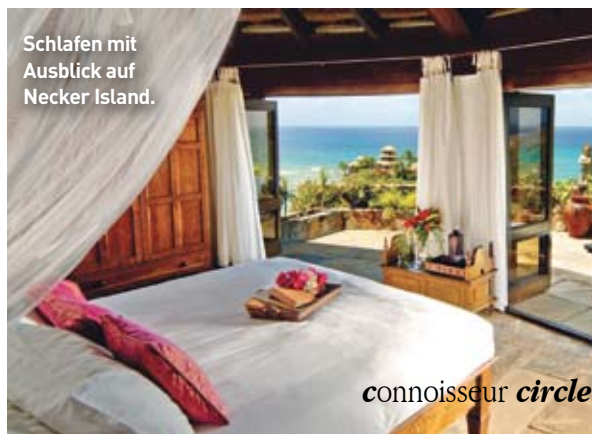
Schlafen mit Ausblick auf Necker Island.

Generell herrscht auf den Inseln eine ruhige und entspannte Atmosphäre. Genuss wird hier groß geschrieben und somit ist es nicht weiter verwunderlich, dass auch sehr großer Wert auf eine abwechslungsreiche und gehobene Küche gelegt wird. Denn bei einem tollen Essen auf einer romantischen Meerterrasse lassen sich die einzigartigen Sonnenuntergänge besonders gut genießen.